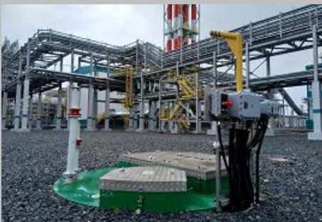
Производство и поставка 30-и комплектных КНС ПАО "СИБУР Холдинг" Западно- Сибирский Нефтехимический комбинат Г. Тобольск