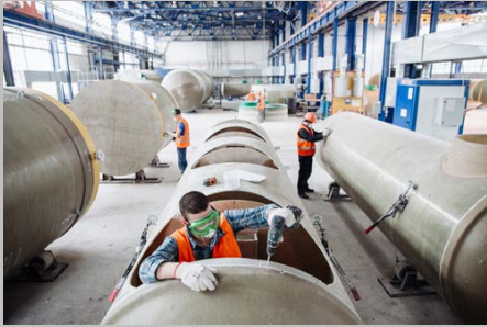
Производство г. Тольятти